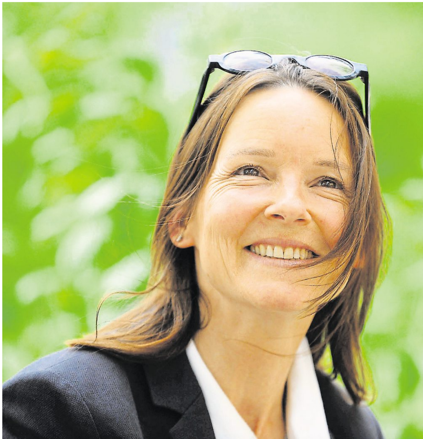
Paris, le 12 mai. Corine Sombrun prête sa plume... au chef indien Almir Surui, lauréat Prix des droits de l'Homme en 2008. Elle a été conquise par son combat pour la protection de la forêt amazonienne.

Intuitif et très au courant du contexte international, le chef indien surfe aujourd'hui sur la prise de conscience qui se fait autour du changement climatique. Il inscrit son action dans le cadre du dispositif « compensation carbone » en l'appliquant à un territoire : « Parce que la forêt amazonienne est le plus grand réservoir de biodiversité au monde avec 390 milliards d'arbres et 16 000 espèces animales