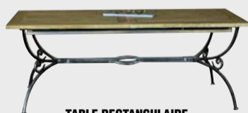
TABLE RECTANGULAIRE , piétement fer forgé, 2 allonges escamotables 200x77x100 (280 ouverte), chêne massif 1126€ dont 8€ d'écotaxe

BONNETIÈRE 80x185x55 chêne massif 837€ dont 4.50€ d'écotaxe