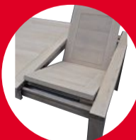
TABLE BASSE 1 TIROIR TRAVERSANT , 1 allonge portefeuille 100x42x50 chêne massif 612€ dont 2.50€ d'écotaxe

TABLE 2 ALLONGES ESCAMOTABLES 110x77x40 (230 cm ouverte), chêne massif 899€ dont 4.50€ d'écotaxe, existe en 160x100 et en 200x110