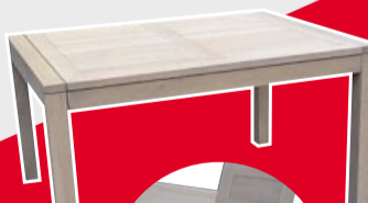
TABLE 2 ALLONGES ESCAMOTABLES 110x77x40 (230 cm ouverte), chêne massif 899€ dont 4.50€ d'écotaxe, existe en 160x100 et en 200x110

BUFFET 2 PORTES 3 TIROIRS 145x95x50, chêne massif 900€ dont 4.50€ d'écotaxe