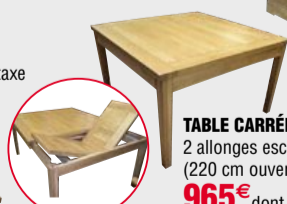
TABLE CARRÉE 130x77x130, 2 allonges escamotables (220 cm ouverte), chêne massif 965€ dont 4.50€ d'écotaxe

MEUBLE TV , porte coulissante 1 tiroir 140x52x45 sur roulettes chêne massif 719€ dont 4.50€ d'écotaxe