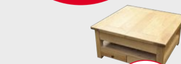
TABLE BASSE 86x42x86 4 tiroirs, 1 allonge centrale (existe rectangulaire en 120x60) chêne massif, 620€ dont 2.50€ d'écotaxe